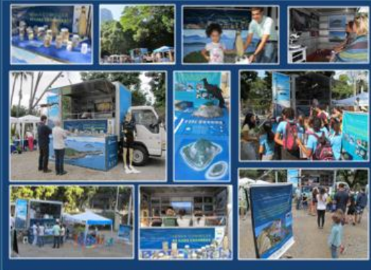
Espaços temáticos das exposições itinerantes do Projeto Ilhas do Rio realizadas no Jardim Botânico, Parque Lage e Museu Nacional